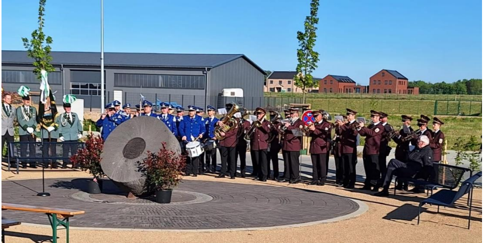
Ehrenmal vorne, Fahne Kuckum mit TC Venrath und MV Kevenberg

Denkmals und des Platzes, auf dem es steht, waren der Künstler Michael Franke aus Berverath, Dipl.-Bauing. Simone Portz aus Westrich sowie Architekt Sebastian Bauten aus Keyenberg. Beendet wurde die feierliche Einweihung des Ehrenmals mit dem Großen Zapfenstreich . Ausgeführt vom Trommler- und Pfeifercorps Venrath 1920 und dem St. Josephs Musikverein Keyenberg 1886 . Im Anschluss fand die erste gemeinsame Maifeier der neuen Umsiedlungsdörfer statt. Die Bruderschaft haben sich darauf geeinigt, die Feier in Zukunft abwechselnd auszurichten – ein Zeichen des Zusammenhalts.