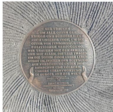
Bronzetafel im Ehrenmal (Auszug einer Rede vom ehem. Bundespräsidenten Richard v. Weizsäcker)