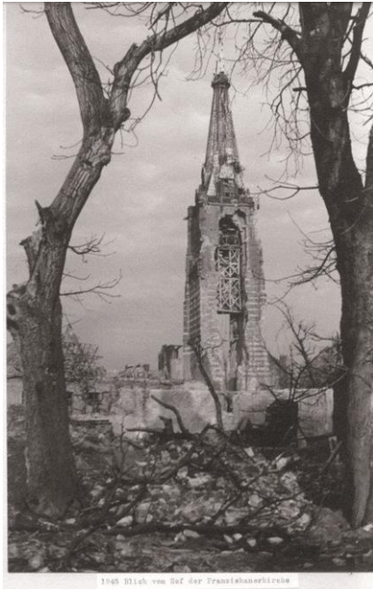
1945 Blick vom Hof der Franziskanerkirche